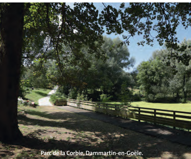
Parc de la Corbie, Dammartin-en-Goële.