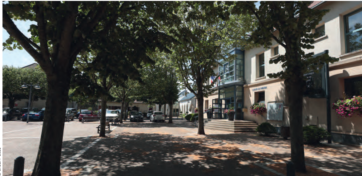
Place des Prieurs, Dammartin-en-Goële.

Des projets ? N'hésitez pas à faire appel au CAUE77 via id77.fr ou directement par courriel : accueil@caue77.fr . Ces conseils, financés par la taxe d'aménagement, restent gratuits.